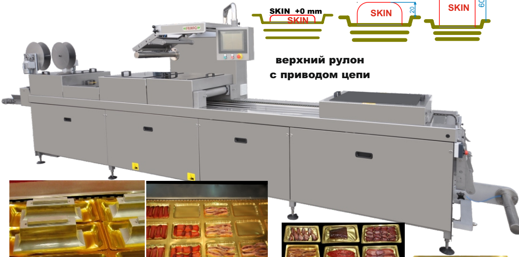
верхний рулон с приводом цепи