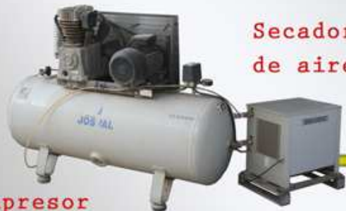
Secador de aire