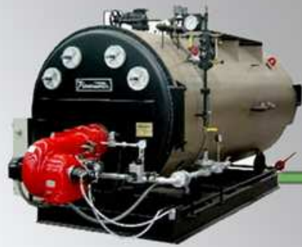
Caldera de vapor