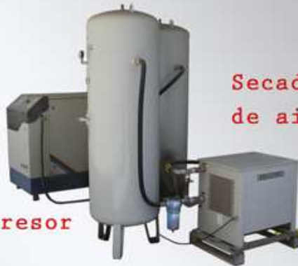
Secador de aire